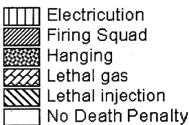
Figure 1. Execution methods by state